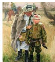
Дети-герои и свидетели войны