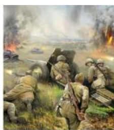
Солдаты Родины моей

База дадзеных «Мы гэтай памяці адданы» складаецца з 3 асноўных рубрык: «Салдаты Радзімы маёй», «Партызанскімі сцежкамі», «Дзеці героі і сведкі вайны», якія змяшчаюць біяграфічную, фактаграфічную,