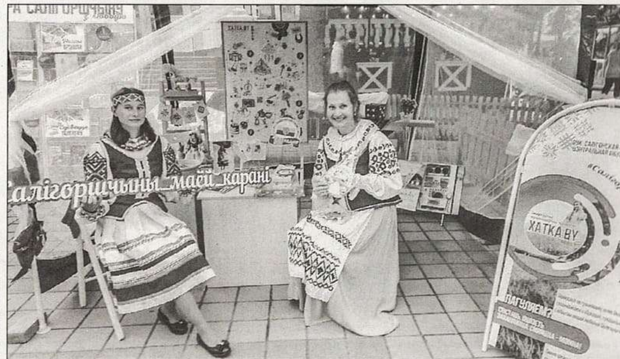
■ Образ белорусской хатки дополнили гости национального фестиваля, облачённые в традиционные костюмы