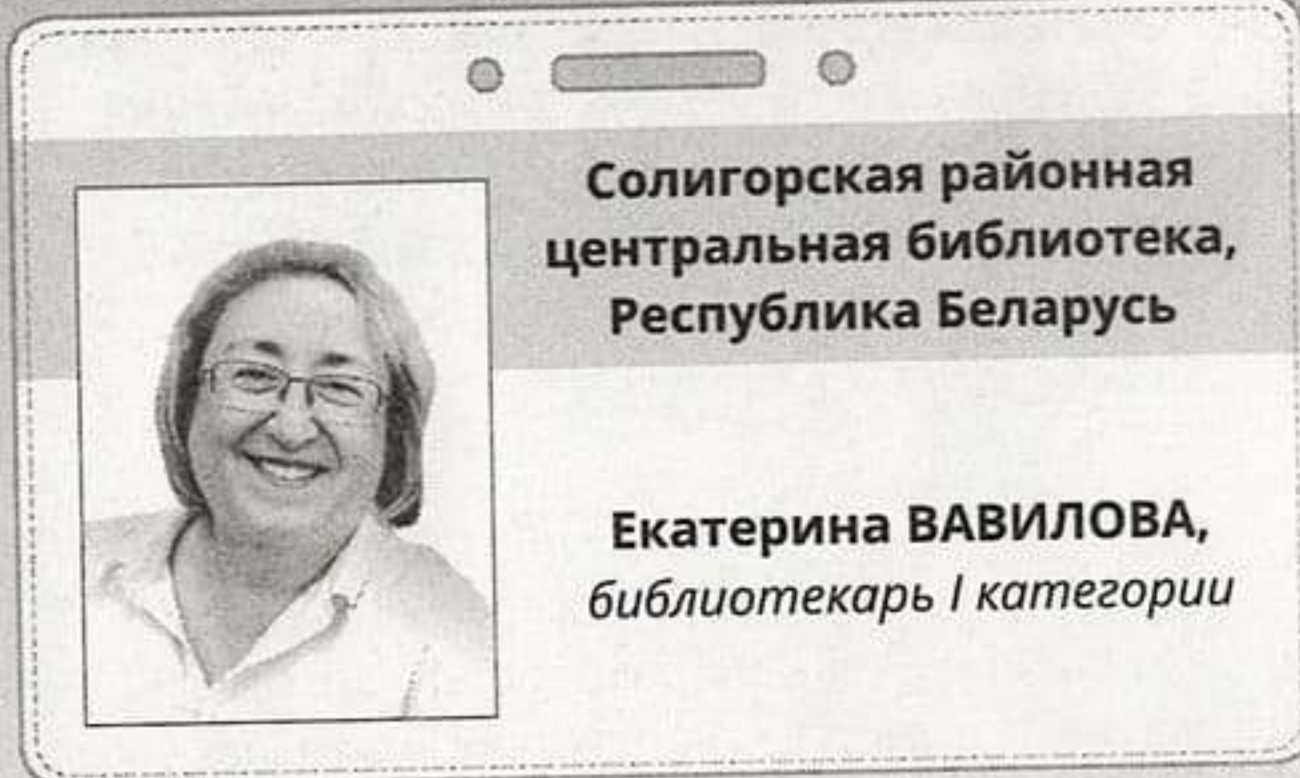
Солигорская районная центральная библиотека, Республика Беларусь