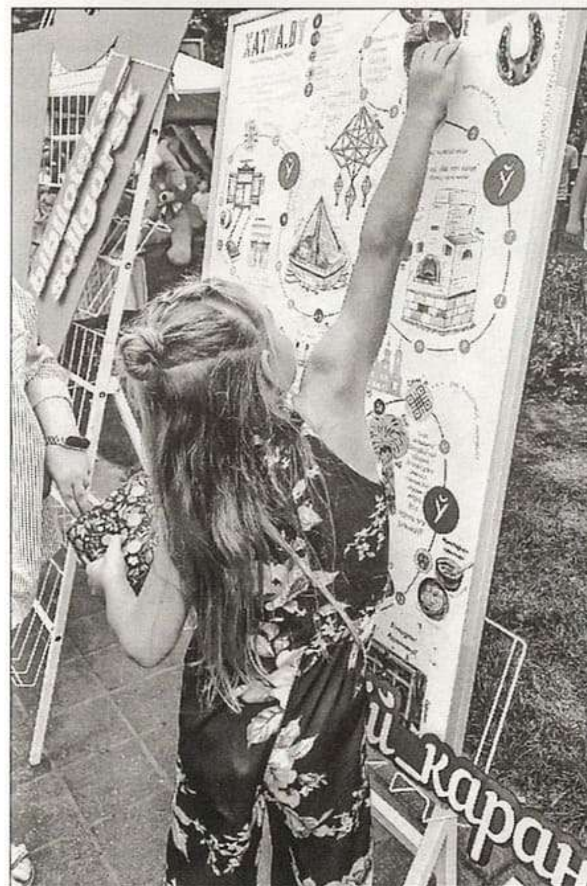
■ Вместо фишек участникам предлагалось вооружиться миниатюрными магнитными лаптями

«Щедрец». В 2014-м перечень пополнила уникальная новогрудская технология создания бумажных кружев — вытинанка-выбиванка. Думаете, узоры вырезали ножницами? Ничуть не бывало! Для этого использовались молоток и стамеска!