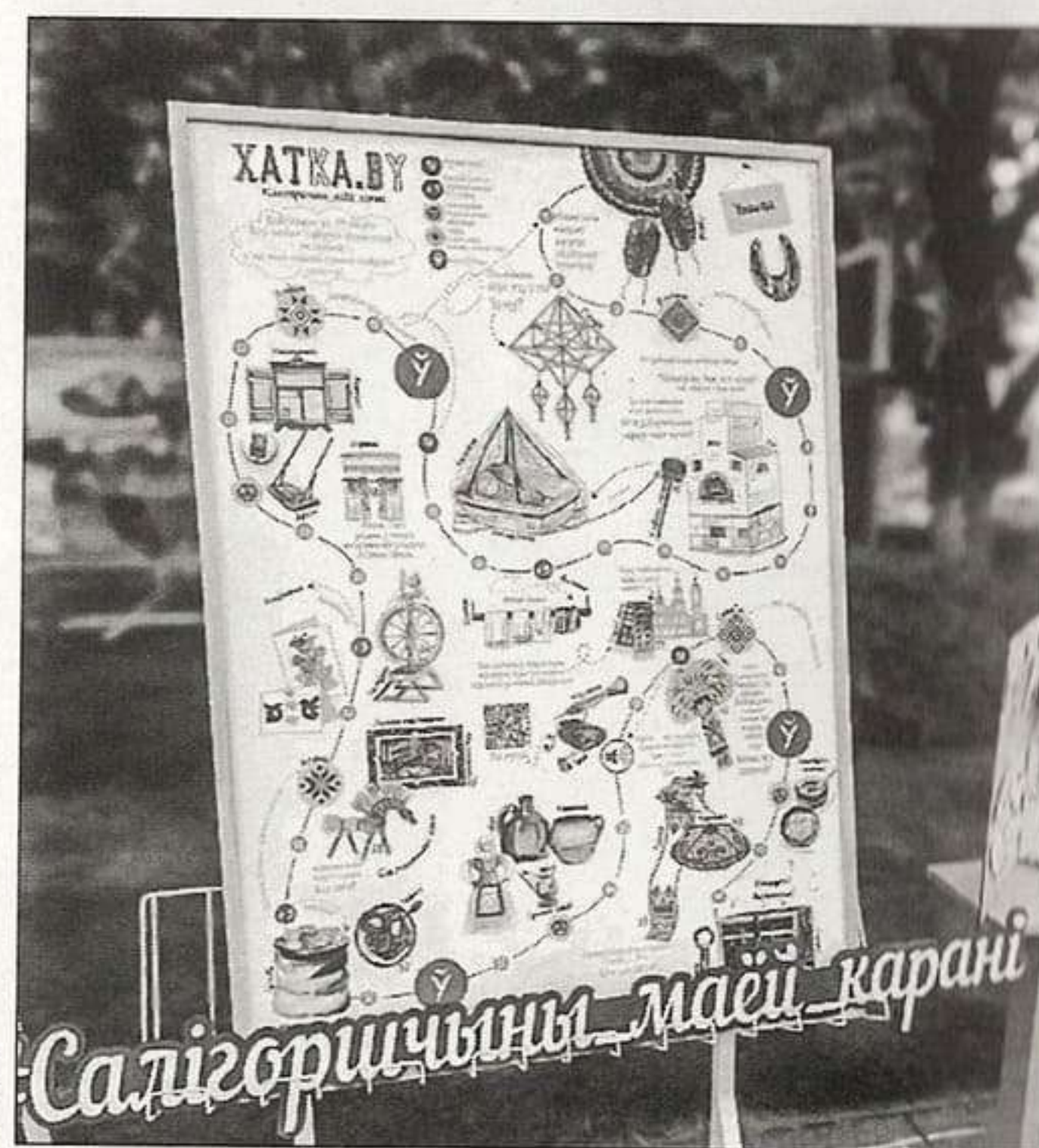
■ Пройдя от старта к финишу, можно узнать о традициях республики и объектах нематериального культурного наследия