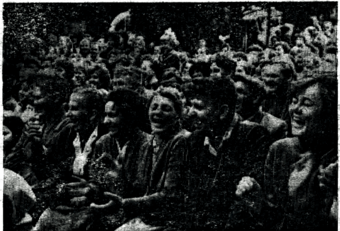
ПРИЯТНО НА СВЕЖЕМ ВОЗДУХЕ ПОСМОТРЕТЬ ИНТЕРЕСНЫЕ ВЫСТУПЛЕНИЯ.

До позднего вечера продолжались народные гулянья. А когда сгустились сумерки, красочно оформленные улицы, здания города встречали солигорцев светом электрических огней. В гости к себе приглашали кинотеатр, Дом культуры, летняя танцплощадка.