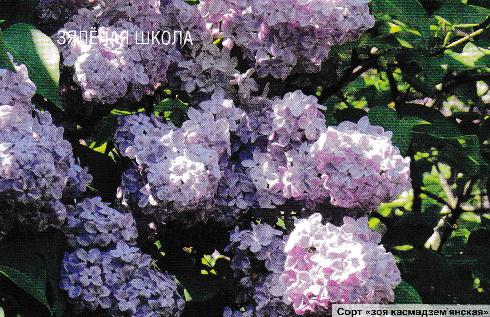
Сорт «зоя касмадзеянская»