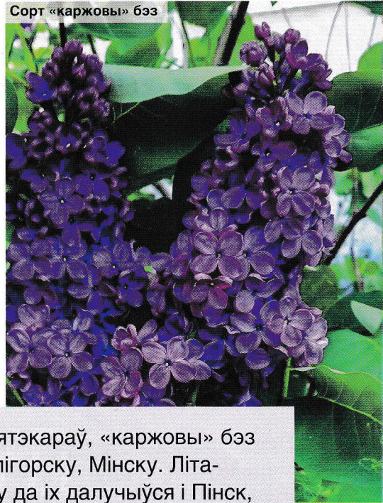
Сорт «каржовы» бэз

Дзякуючы намаганням бібліятэкараў, «каржовы» бэз пасаджаны ў Старобіне, Салігорску, Мінску. Літаральна некалькі тыдняў таму да іх далучыўся і Пінск, дзе кветка-прыгажуня з'явілася каля мемарыяльнага знака Васілю Каржу на Паляне партызанскай славы.