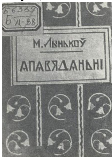
Вокладка першага зборніка Міхася Лынькова "Апавяданні".

Пачаў друкавацца з 1919 г. Выступіў у друку з апавяданнямі ў 1926 г. Выдаў зборнікі прозы «Апавяданні» (1927), «Гой» (1929), «Андрэй Лятун», «Апошні зверыдавец» (абодва – 1930), «На вялікай хвалі» (1934), «Баян» (1935), «Сустрэчы» (1940), «Астап» (1944) і інш. Аўтар раманаў «На чырвоных лядах» (1934), «Векапомныя дні» (1958, 2-е перапрац. выд. – 1969). Напісаў нарыс «Герой Савецкага Саюза Канстанцін Заслонаў» (1944). Аўтар кніг для дзяцей «Пра смелага ваяку Мішку і яго слаўных таварышаў» (1937), «Міколка-паравоз» (1937), «Янка-парашутыст» (1937), «Ядвісін дуб» (1940) і інш. Міхасю Лынькову належаць літаратуразнаўчыя працы «Беларуская літаратура за 30 год» (1948, на беларускай і рускай мовах), «Якуб Колас» (1952), «Летапіс эпохі: Беларускай савецкай літаратуры пяцьдзясят год» (1968). зборнікі «Літаратура і