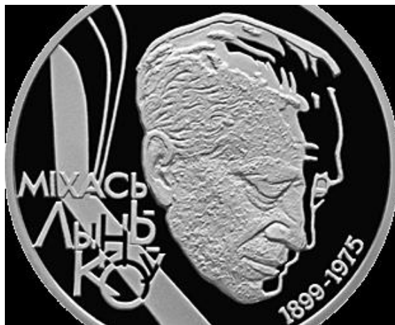
Юбілейная манета Нацбанка Беларусі ў гонар 100-годдзя з дня нараджэння М. Лынькова.

Узнагароджаны трыма ордэнамі Леніна, трыма ордэнамі Працоўнага Чырвонага Сцяга, ордэнам Чырвонай Зоркі, медалямі. Пераклаў на беларускую мову асобныя творы А. Гідаша, М. Горкага, М. Ціханавы і інш. Імем Міхася Лынькова названы вуліцы ў Мінску і Бабруйску, у пасёлку Лужасна Віцебскага раёна, яго імя носіць Крынкаўская сярэдняя школа Лёзненскага раёна, мемарыяльныя дошкі ўсталяваны ў Мінску на доме № 12 на праспекце Незалежнасці, дзе жыў народны пісьменнік, на доме № 1 па вуліцы Міхася Лынькова, у Бабруйску на будынку, дзе месцілася рэдакцыя газеты «Камуніст».