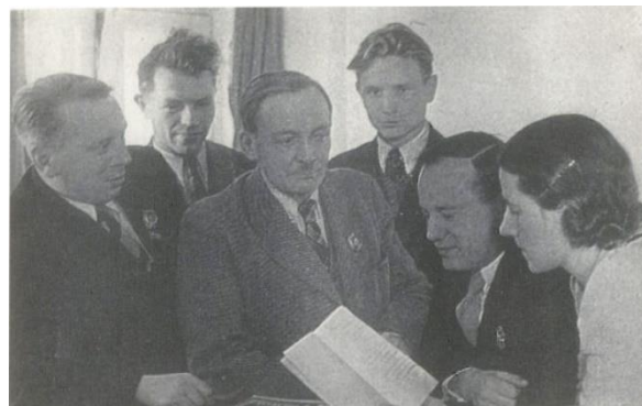
Міхась Лынькоў, Макар Паслядовіч, Янка Купала, Максім Танк, Пятрусь Броўка і Яніна Бранеўская. 1940г.

Саюза пісьменнікаў Беларусі (1932-1934) гг.), старшынёй праўлення Саюза пісьменнікаў БССР (1938-1948 гг.) з 1934 па 1941 г. рэдагаваў часопіс «Полымя рэвалюцыі». Удзельнік паходу Чырвонай Арміі ў Заходнюю Беларусь (1939), рэдагаваў газету «Беларуская звязда» – орган палітупраўлення Беларускага фронту. У 1941-1942 гг. – рэдактар франтавой газеты «За Савецкую Беларусь» (выходзіла на Заходнім, Цэнтральным і Бранскім франтах). У час вайны друкаваўся ў газетах «Правда», «Известия», «Раздавім фашысцкую гадзіну» і інш. У 1943-1946 гг. і 1949-1952 гг. – дырэктар Інстытута літаратуры, мовы і мастацтва АН БССР. Выбіраўся кандыдатам у члены ЦВК БССР (1921-1931 гг.), дэпутатам Вярхоўнага Савета БССР 1-га склікання (1940-1945). У складзе дэлегацыі БССР неаднаразова ўдзельнічаў у працы сесій Генеральнай Асамблеі ААН. У Саюзе пісьменнікаў СССР з першага года ўтварэння (1934).