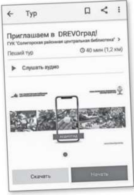
■ Результат работы — уникальный тур, где любой пользователь может почувствовать себя наедине с гидом

те остановились на международной платформе izi.TRAVEL, предназначенной для создания путеводителей. Важный нюанс: разрабатывать и редактировать аудиогиды с её помощью можно только на стационарном компьютере.