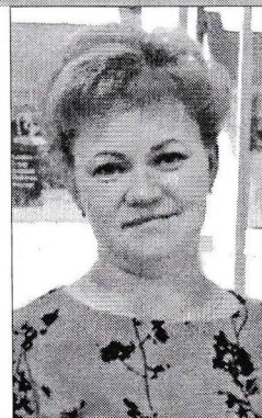
Заведующая отделом Солигорской районной центральной библиотеки

Белорусские местечки представляют собой особый уникальный социокультурный феномен, занимающий важное место в культуре страны. Возникшие как торгово-посреднические центры, они сочетают черты городского и сельского укладов жизни населения. Феномен местечка заключается в создании малого социума, где тесно выражено «землячество», все люди объединены между собой общими историческими, культурными связями, традициями и взглядами. Библиотеки в местечках являются авторитетными учреждениями и выполняют важную социокультурную функцию. Они становятся неотъемлемой частью воспитания и личностного становления детей и подростков, местом общения старшего поколения.