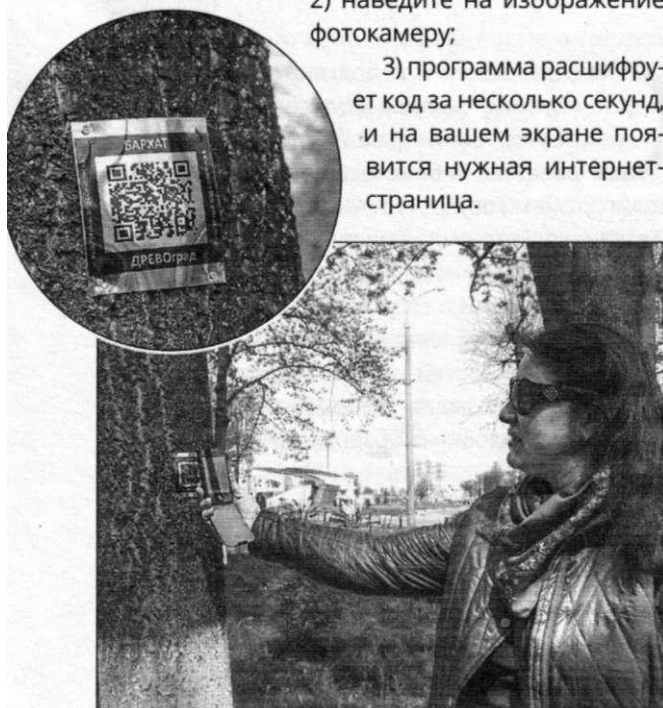
■ Чтобы больше узнать о необычном дереве, достаточно навести камеру смартфона на QR-код

3) программа расшифрует код за несколько секунд, и на вашем экране появится нужная интернет-страница.