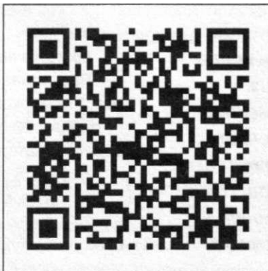
■ Код доступа к сайту Солигорской районной библиотеки

«Культурные навигаторы» познакомили участников мероприятия с растущими здесь нетипичными для городского озеленения деревьями и кустарниками: бархате амурском, лохе серебристом, клёне татарском, аморфе кустарниковой, катальпе. Они продемонстрировали, как с помощью установленной на мобильном устройстве специальной программы и таблички с QR-кодом, прикреплённой непосредственно к дереву, можно легко найти информацию о нём. Первыми путешественниками по маршруту стали одноклассники ребят и члены клуба «Флора». Теперь любознательная молодёжь сможет самостоятельно выйти на сайт библиотеки и получить информацию о редких растениях.