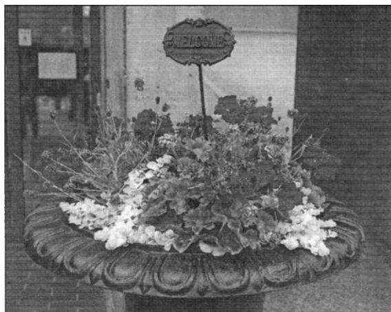
• Яркий цветник возле входа создаёт первое впечатление о библиотеке

Один из самых «оких» цветов — жёлтый. Частица солнца даже в пасмурный день нам не помешает! Только не забудьте о том, что он очень активен. При устройстве широкого цветника-миксбордера помещенные на задний план