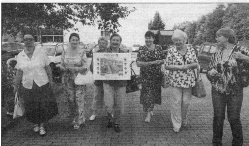
● Участники ситикэшинга выходят на поиск тайников

В самом центре сада красуется большое дерево с удивительной корой, мимо которого точно никто не пройдёт. Это черёмуха Маака. В конце весны она покрывается мелкими белыми цветками, собранными в небольшие кисти. В это время неумолчный пчелиный гул стоит в её кронах. Дерево считается одним из лучших медоносов Дальнего Востока. В природе его плоды — одно из любимейших лакомств медведей, за что оно прозвано «медвежья черёмуха». Но самое заметное у дерева — кора: коричнево-красная или золотисто-бурая, иногда почти бронзовая, она состоит из расположенных поперёк тонких плёнок. «Красавица в лохмотьях» — в шутку говорят о черёмухе Маака.