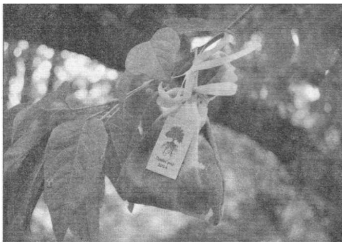
● Ключевые эпизоды приключенческой игры коллеги связали с местами, где растут редкие деревья