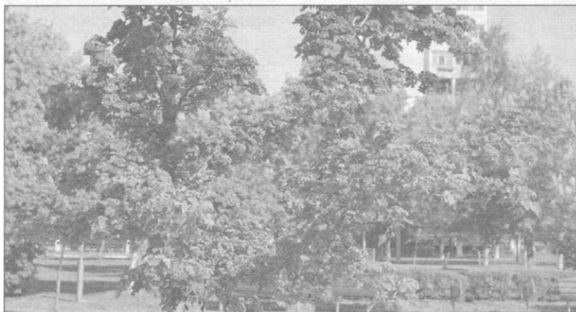
● Боярышник — главное украшение Парка четырёх стихий