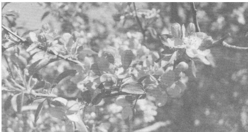
● Яркое цветение яблони Недзвецкого выглядит как настоящий праздник

Нет городов неинтересных или некрасивых. В этом любой может убедиться, пройдя вместе с цветоводами клуба «Флора» Солигорской РЦБ по «зелёному» экскурсионному маршруту. И вам вполне по силам разглядеть прекрасное и необычное на улицах вашего города и показать это своим гостям и читателям.